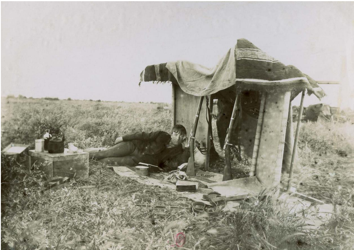
L'archéologue et exploratrice Jane Dieulafoy (1851-1916) se reposant sous une tente de fortune, lors des fouilles de la cité de Suse, en 1885.