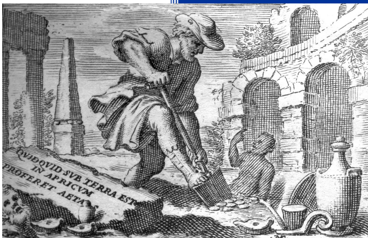
Frontispice de l'édition des Comédies de Plaute, par Giuseppe Comino, Padoue, 1725. Quidquid sub terra est in apricum proferet aetas : « Tout ce qui est sous terre retourne à la lumière avec le temps ».